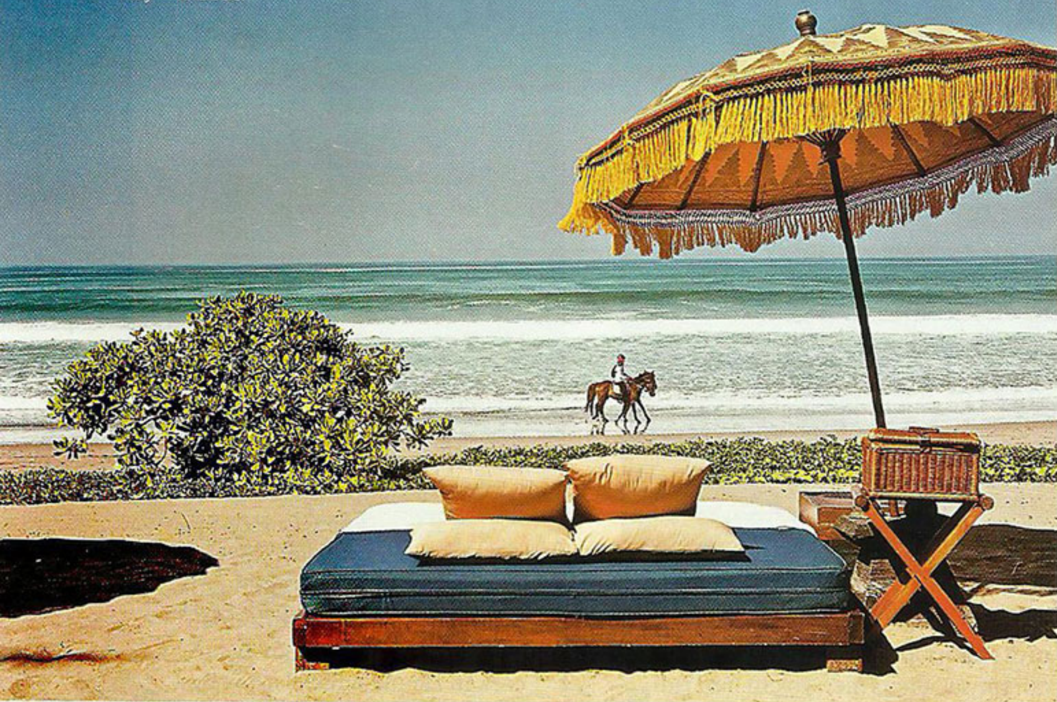
▼ OBEROI BALI - Day Bed by The Beach